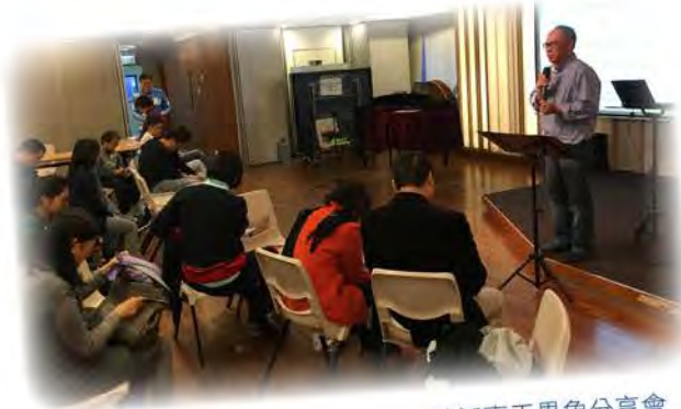
英語事工異象分享會

至於關懷貧窮方面，我們在中西區每周有派送飯盒行動，關心露宿者已近兩年時間；同時亦有不少弟兄姊妹正在參予不同關愛基層的計劃。在這方面，楊牧師已招聚了多位有負擔及恩賜的會友，更深入探討教會在關懷貧窮這個課題上可怎樣發展。