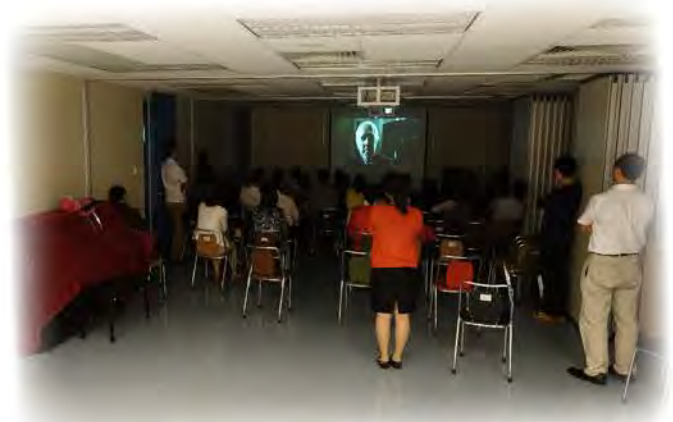
普通話電影欣賞分享聚會