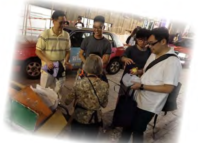
某次周五晚上派送飯盒