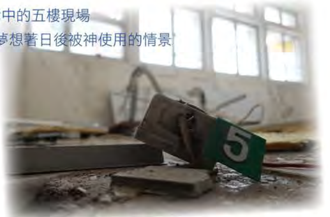
夢想著日後被神使用的情景